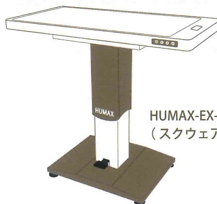
HUMAX-EX-Sn - 望 (スクウェア天板)