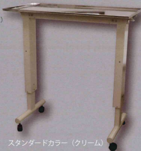
スタンダードカラー (クリーム)

天板：W1020×D420mm 昇降範囲：880～1,230mm 天板：ステンレス (SUS304) 脚：スチール カラー：スタンダードカラー (クリーム) ：オーダーカラー (メタリック) ※他お問い合わせ下さい