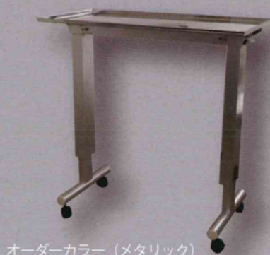
オーダーカラー (メタリック)