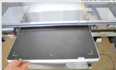
写真は EH1500 C