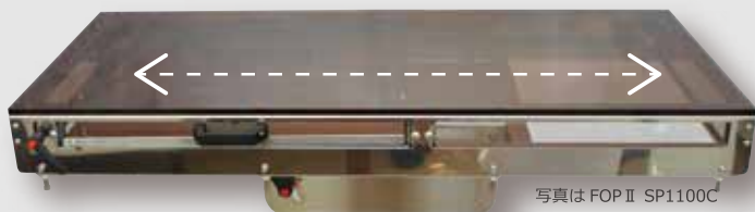
写真は FOP II SP1100C