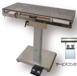
サービスコンセント